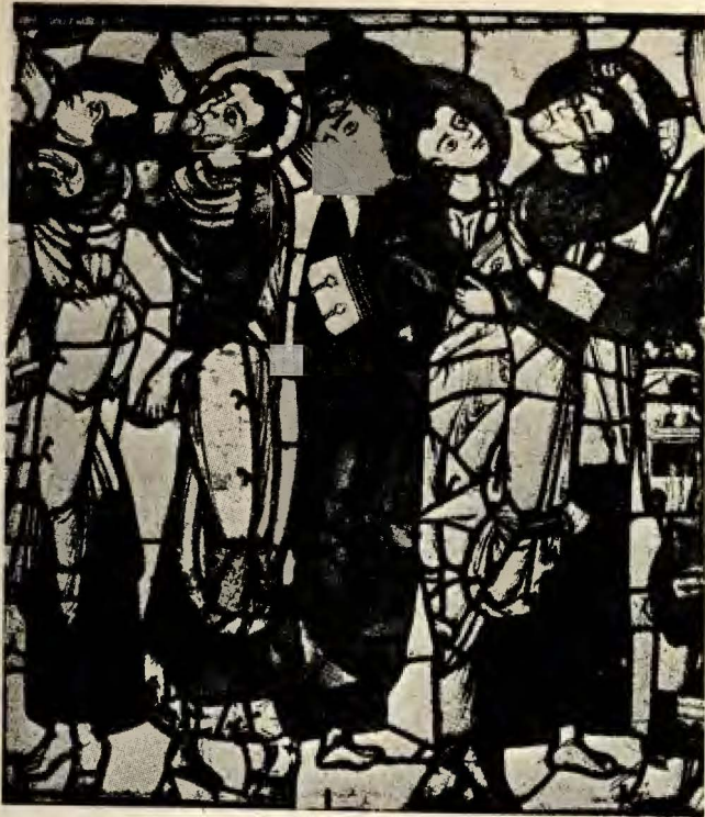
Catedral de Poitiers. Fragm. de vitrail gótico de la crucifixión.