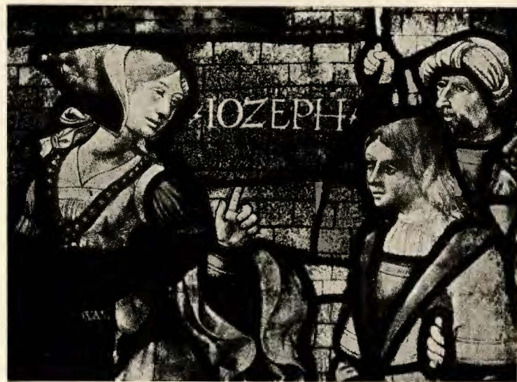
Fragmento de un vitrail de Vic-le Compte, siglo IV.

como complemento decorativo, verdadera misión del vitrail. Su estructura está, pues, subordinada a leyes fundamentales, que no podrán ya ser desvirtuadas de este primitivo camino. El motivo pictórico, cartón o proyecto, están sometidos a este fin primordial. Este diseño enérgico y altamente ornamental del plomo no es más que la repartición sabia de grandes espacios fragmentados y en relación unos con otros. Es una orquestación decorativa, por decirlo así, vigorosamente contrastada. La sabia y artística repartición de motivos luminosos entre los paños murales y la relación integral del motivo pictural entre barras es lo que nos seduce, ante todo, en la contemplación de un auténtico vitrail. Estos joyeles coloreados, a través de los cuales la luz chispea en sus valores más altos y pasa amortiguada a través