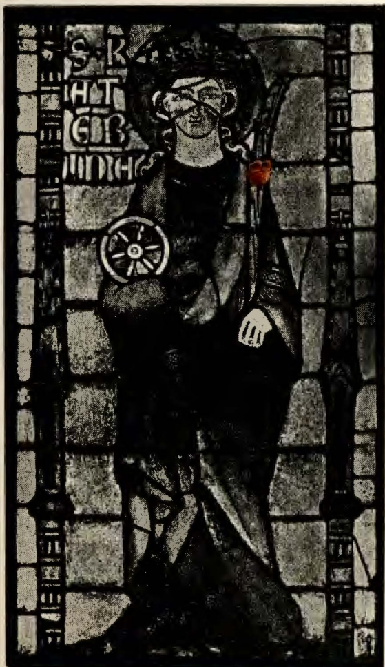
Vitrail Bávaro, siglo IV. Claustro Seligenthal.

como complemento decorativo, verdadera misión del vitrail. Su estructura está, pues, subordinada a leyes fundamentales, que no podrán ya ser desvirtuadas de este primitivo camino. El motivo pictórico, cartón o proyecto, están sometidos a este fin primordial. Este diseño enérgico y altamente ornamental del plomo no es más que la repartición sabia de grandes espacios fragmentados y en relación unos con otros. Es una orquestación decorativa, por decirlo así, vigorosamente contrastada. La sabia y artística repartición de motivos luminosos entre los paños murales y la relación integral del motivo pictural entre barras es lo que nos seduce, ante todo, en la contemplación de un auténtico vitrail. Estos joyeles coloreados, a través de los cuales la luz chispea en sus valores más altos y pasa amortiguada a través