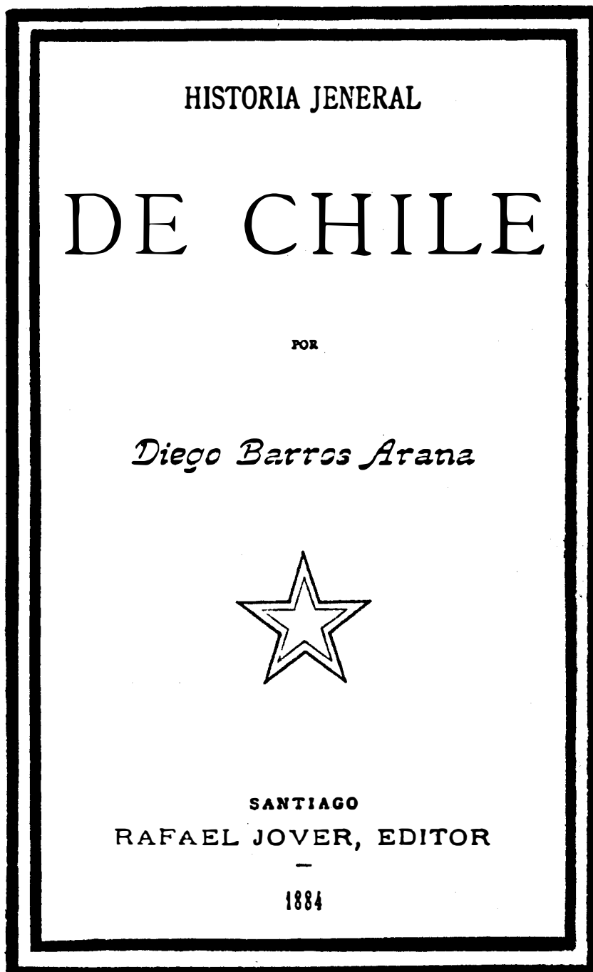
Portada del "Prospecto" de la Historia General de Chile de don Diego Barros Arana