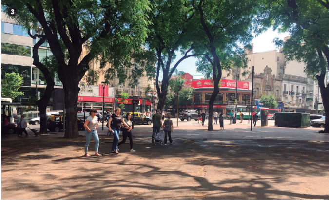
3. Esquina transitada del Parque de los Patricios frente a Av. Caseros y Av. Monteagudo.